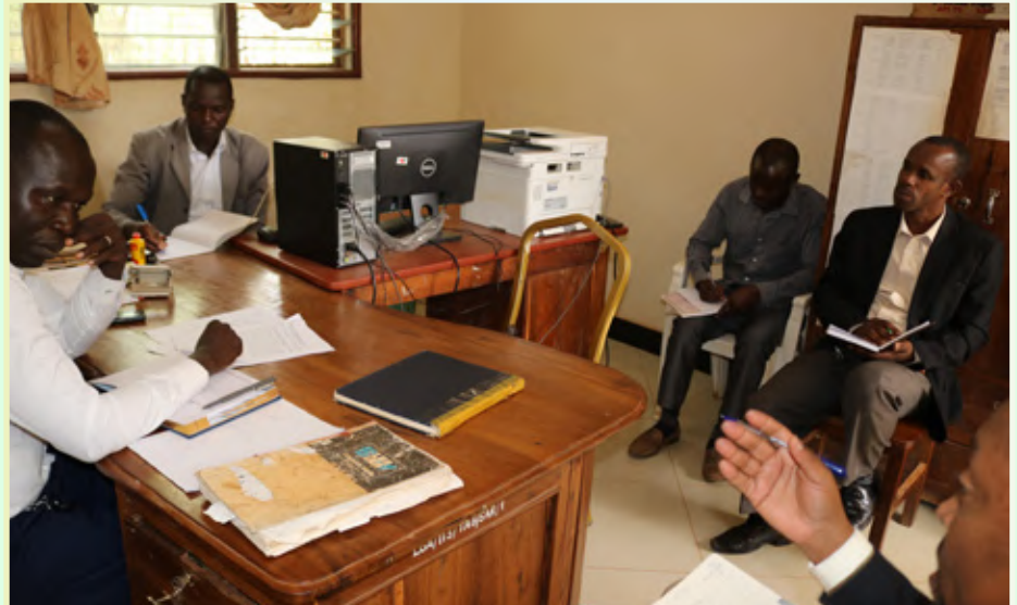
Kikao cha Mkuu wa Kitengo cha Mawasiliano ya Serikali kutoka TSC Makao Makuu na watumishi wa Tume Wilaya ya Bukombe kikiwa kinaendelea.

Aliongeza kuwa katika kutekeleza jukumu hilo la uhamasishaji na utoaji elimu kwa Walimu na Wanafunzi, ziara mbalimbali zimekua zikifanyika ikiwa ni sehemu ya juhudi hizo kwa kushirikiana na Maafisa Elimu