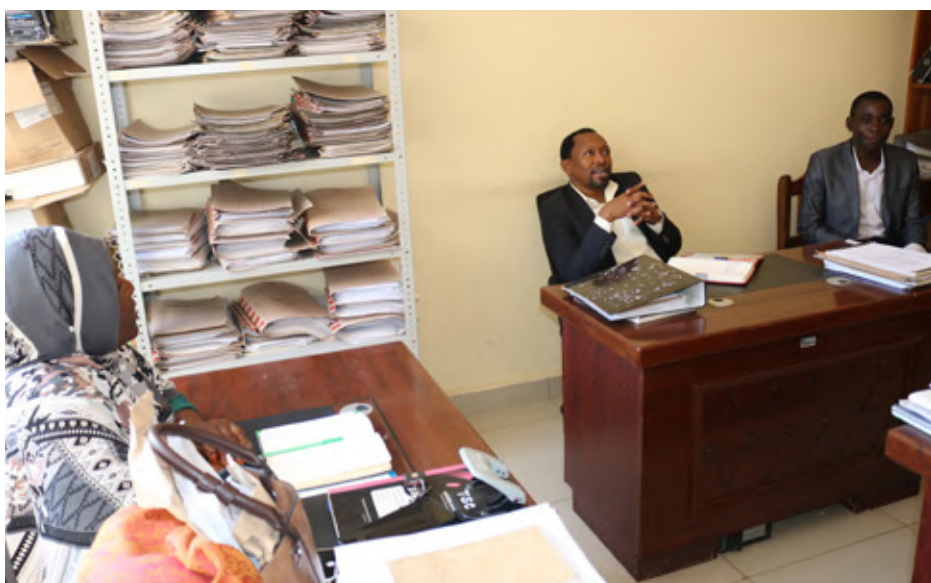
Kikao cha Mkuu wa Kitengo cha Mawasiliano ya Serikali kutoka TSC Makao Makuu na watumishi wa Tume Wilaya ya Mbogwe kikiwa kinaendelea.

Vilevile Mwl. Masaza alisema wanafunzi hao walipata fursa kuwasilisha kero zao kwa uwazi huku wengine wakiwasilisha