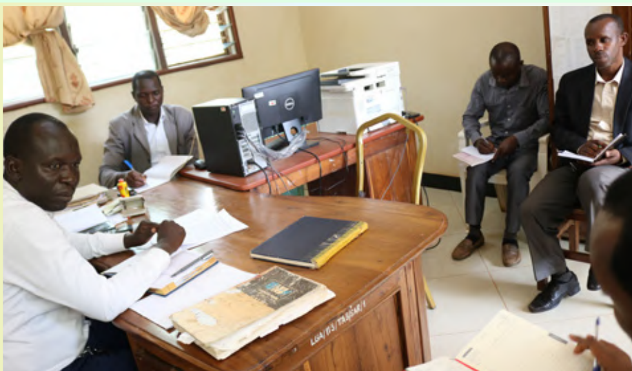
Kikao cha Mkuu wa Kitengo cha Mawasiliano ya Serikali kutoka TSC Makao Makuu na watumishi wa Tume Wilaya ya Bukombe kikiwa kinaendelea.