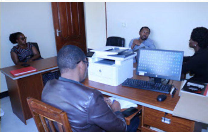
Kikao cha Mkuu wa Kitengo cha Mawasiliano ya Serikali kutoka TSC Makao Makuu na watumishi wa Tume Wilaya ya Ikungi kikiwa kinaendelea.

“Katika mwaka huu wa fedha 2022/2023 tumepandisha vyeo walimu 384 ambapo katika idadi hiyo, walimu 311 ni wa shule za msingi na 73 ni wa sekondari. Walimu 317 wameidhinishwa katika mishahara ya vyeo vyao vipya mwezi Mei, 2023. Taratibu za kuwaidhinishia mishahara ya vyeo vipya kwa walimu 67 waliobaki zinaendelea kufanywa na Ofisi ya Rais, Menejimenti ya Utumishi wa Umma na Utawala Bora,” alisema.