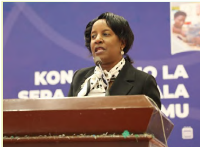
Mwenyekiti wa Kamati ya Kudumu ya Bunge ya Elimu, Utamaduni na Michezo, Prof. Kitila Mkumbo, akizungumza wakati wa kongamano la kujadili sera na mitaala mipya ya elimu ya awali, msingi, sekondari na ualimu lililofanyika jijini Dodoma tarehe 12-14 Mei, 2023.