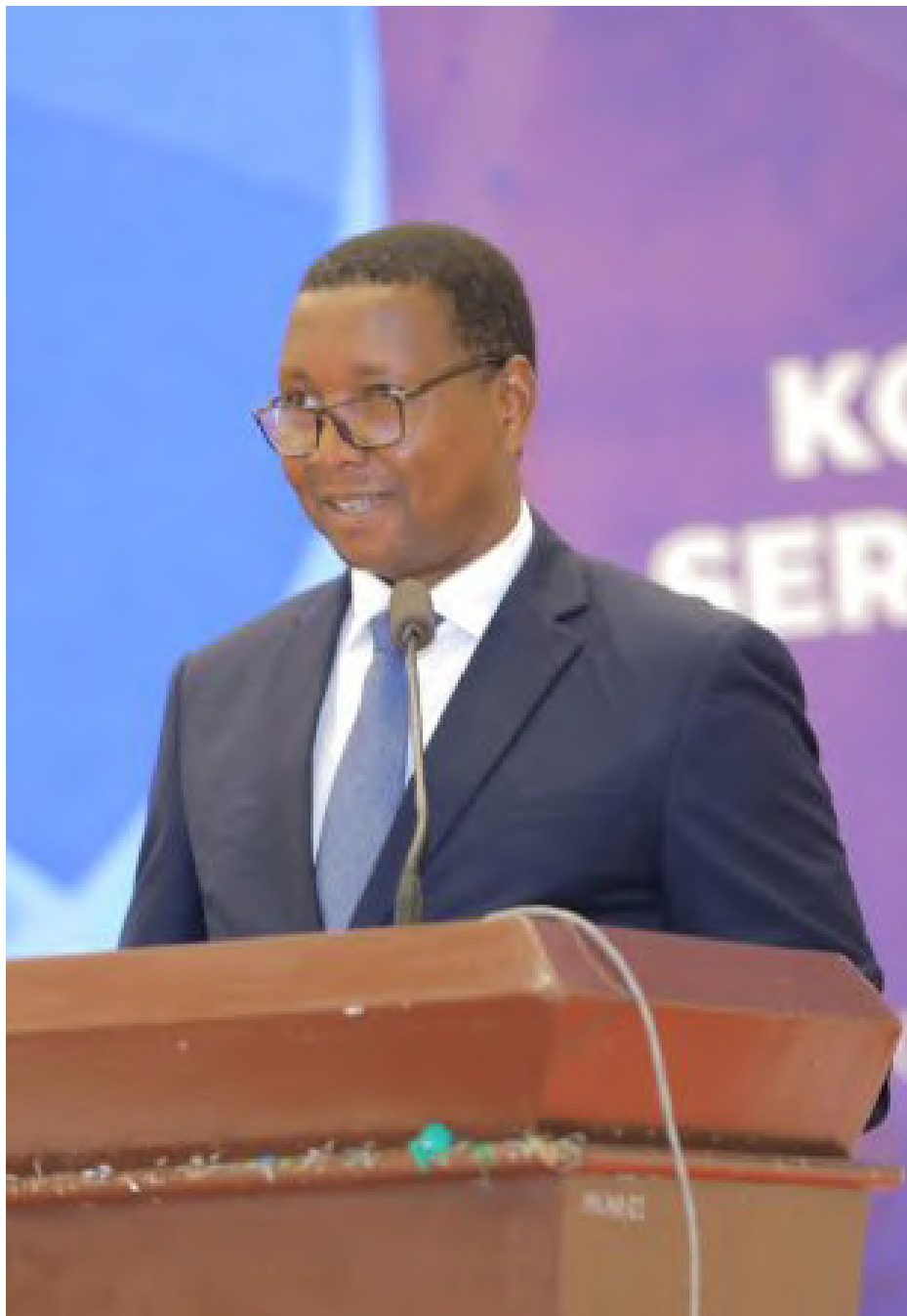
Waziri wa Elimu, Sayansi na Teknolojia, Prof. Adolf Mkenda, akizungumza wakati akifungua kongamano la kujadili sera na mitaala mipya ya elimu ya awali, msingi, sekondari na ualimu linalofanyika jijini Dodoma tarehe 12-14 Mei, 2023.