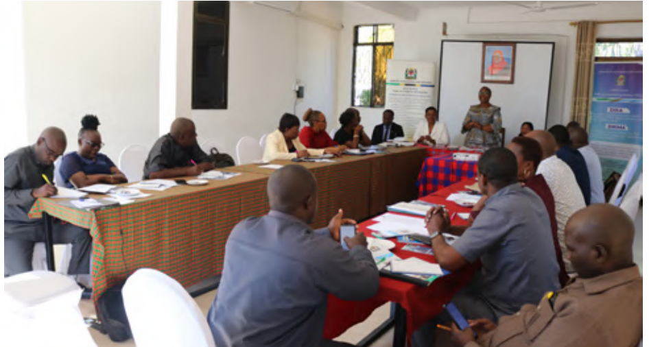
Washiriki wa kikao kazi cha kupitia rasimu ya ufafanuzi wa Sheria ya Tume ya Utumishi wa Walimu Sura 448 na Kanuni zake za mwaka 2016, wakimsikiliza Katibu wa TSC wakati wa ufunguzi wa kikao kazi kilifanyika kwa siku tatu, Mei 31 – Juni 2, 2023 mjini Mpanda.

"Walimu wameheshimishwa sana katika utumishi wao, kwa mfano TSC ngazi ya Wilaya inaundwa na Kamati ya Tume yenye Mwenyekiti, Katibu pamoja